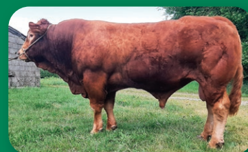
side 21 Franske importtyre