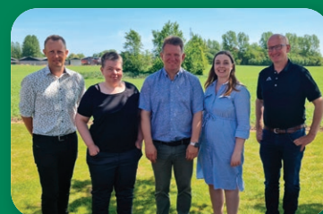
side 13 Bestyrelsen i Dansk Limousine Forening