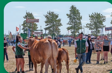
side 5 Program Landsskuet