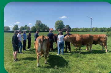
side 11 Limousine ungdom på tur