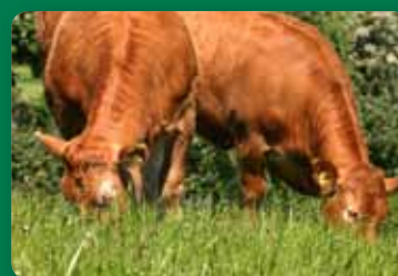
side 26-27 Protein kan være en mangelvare