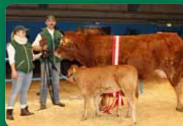
side 3-5 Kødkvægsskuet i Herning