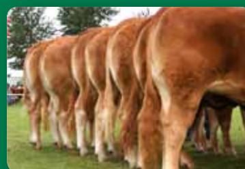
side 8-9 Åbent hus lørdag den 2. februar 2013