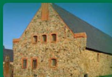
side 3 Auktion på Vilhelmsborg