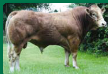
side 11 Ny importtyr