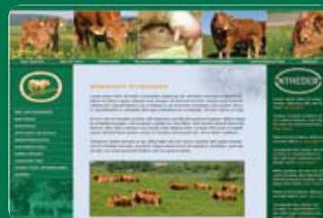
side 5 Ny hjemmeside